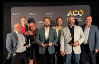
Hub Innovation Mérimov- Grande-Rivière

418 862-6220 | www.leselectriciensdesjardins.com