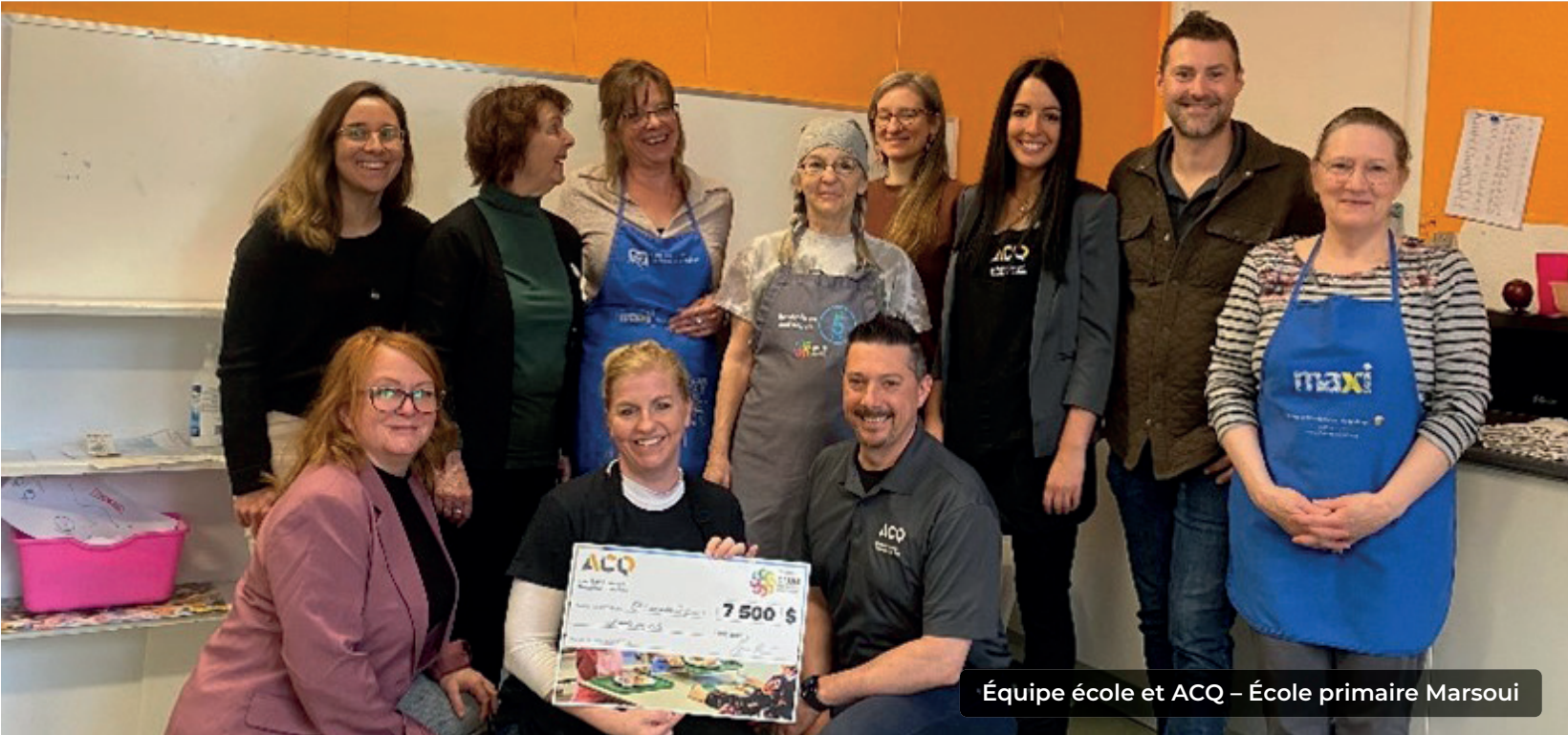
Équipe école et ACQ – École primaire Marsoui

recueilli. À chaque fois, c'est toujours un des moments les plus gratifiants pour nous. L'énergie, l'authenticité et la générosité des bénévoles de ces clubs sont inspirantes. Nous avons le sentiment de faire ce qu'il faut, c'est du pur bonheur ! Depuis 2014, l'association a remis : 84 000 $.