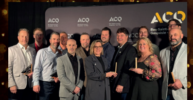
Poste de Police Listuguj Mi'Gmaq