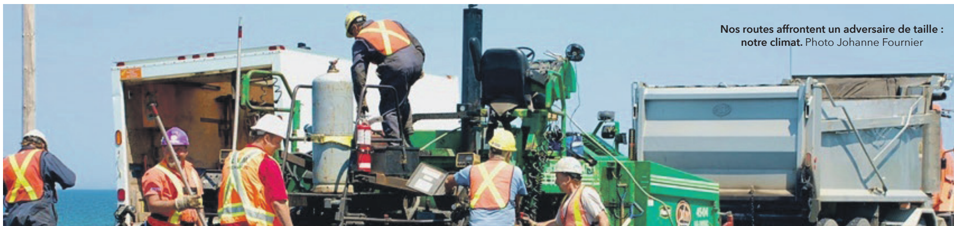
Nos routes affrontent un adversaire de taille : notre climat.