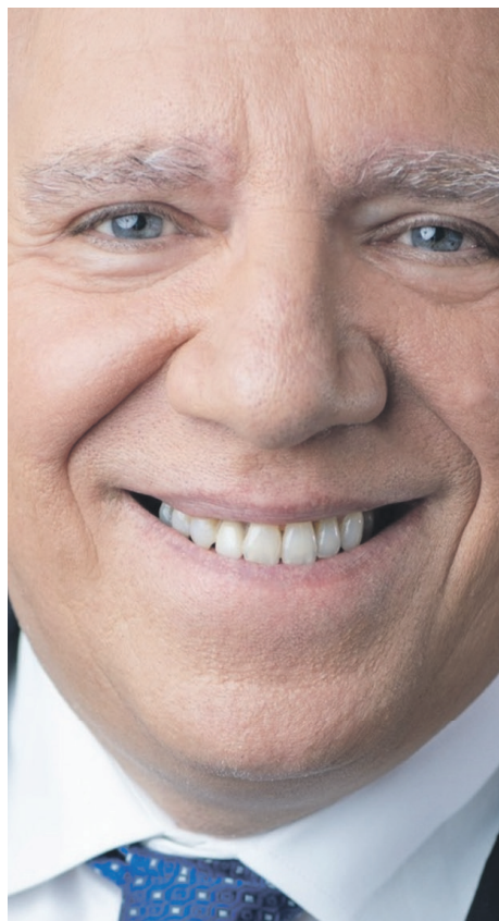
François Legault, Pablo Rodriguez et Paul Saint-Pierre Plamondon

Les libéraux continuent de séduire le milieu anglophone tout en affirmant apprécier les francophones, par nécessité démographique. Leur politique d'immigration massive, tant au provincial qu'au fédéral, s'inscrit dans cette logique. Je ne suis pas raciste, mais je sais que l'on ne quitte pas son pays par plaisir : dictature, guerre ou famine poussent la majorité des immigrants à chercher ailleurs stabilité et sécurité. Leur vote, par réflexe, se dirige souvent vers le camp du non lors des référendums, car ils craignent