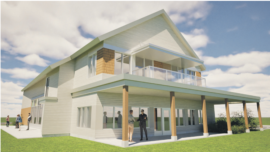
Une maquette de la nouvelle école.

Kathia Guénard confirme que des discussions informelles avec le ministère