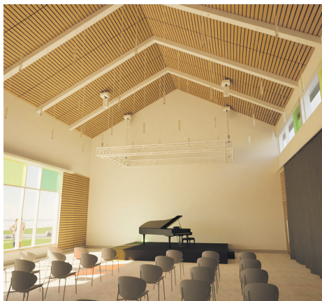
La salle Andrée-Jutras.