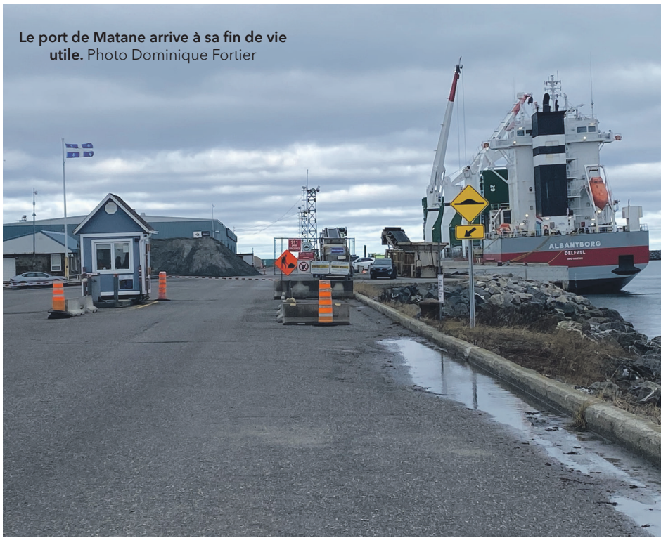
Le port de Matane arrive à sa fin de vie utile.