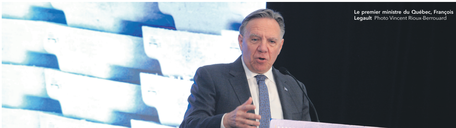
Le premier ministre du Québec, François Legault