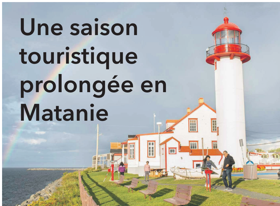
Le phare de Matane.

La tendance observée cet été en Matanie tend à démontrer que la saison touristique commencera plus tôt pour se terminer plus tard dans les prochaines années.