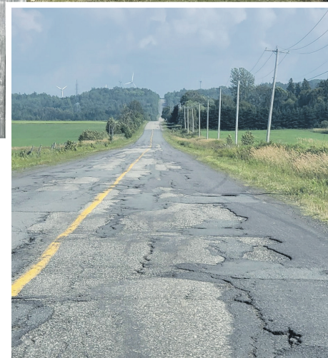
La route Athanase manque cruellement d'amour.

moins qu'on effectue aussi des travaux d'aqueduc et d'égouts, ce qui n'est pas le cas pour la route Athanase.»