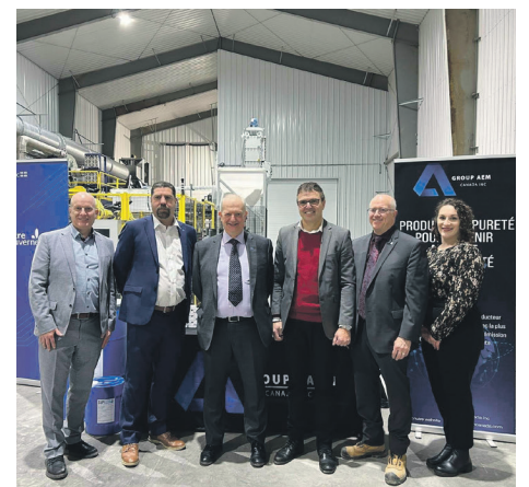
L'annonce s'est faite en compagnie des dirigeants d'AEM et des représentants du gouvernement du Québec.